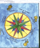
TELAJO strumento tessile tipico